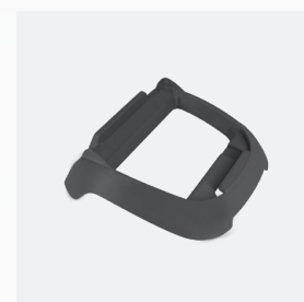
Houders voor schakelkast